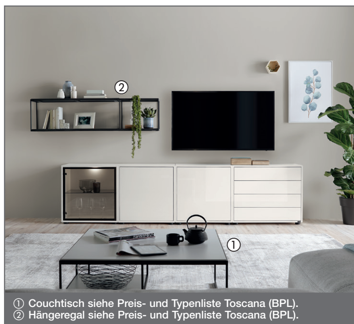
① Couchtisch siehe Preis- und Typenliste Toscana (BPL). ② Hängeregale siehe Preis- und Typenliste Toscana (BPL).