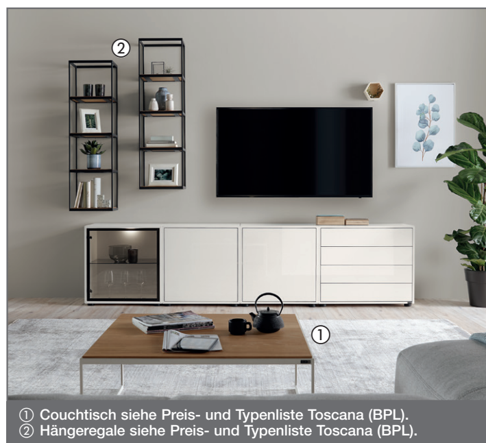
① Couchtisch siehe Preis- und Typenliste Toscana (BPL). ② Hängeregale siehe Preis- und Typenliste Toscana (BPL).